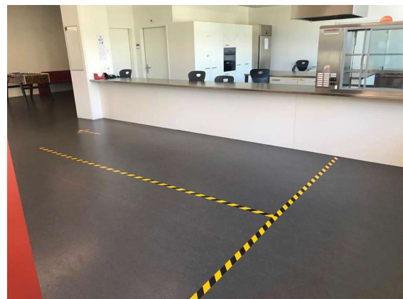
Abbildung 6: GSBS Sansibar