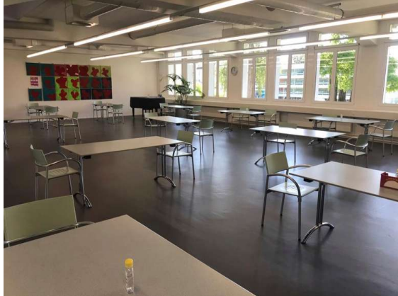
Abbildung 3: GSBS Foyer

Tische und Stühle in Aufenthaltsräumen (Lehrerzimmer, Foyer etc.) werden vom Hausdienst so gestellt, dass die 2-Meter-Abstandsregel eingehalten wird.