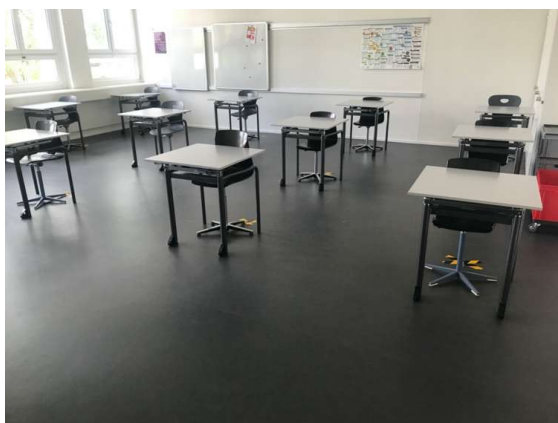
Abbildung 3: GSBS Schulzimmer