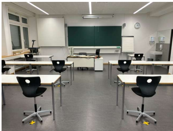
Abbildung 1: KBS Schulzimmer

Die Abstandsregel von 2 Metern ist in der COVID-19-Möblierung der Schulzimmer und Aufenthaltsräume berücksichtigt. Die entsprechenden Markierungen sind von allen zu befolgen.