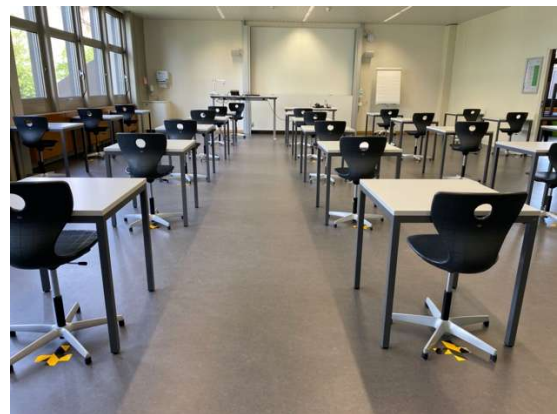
Abbildung 2: EBZ Schulzimmer