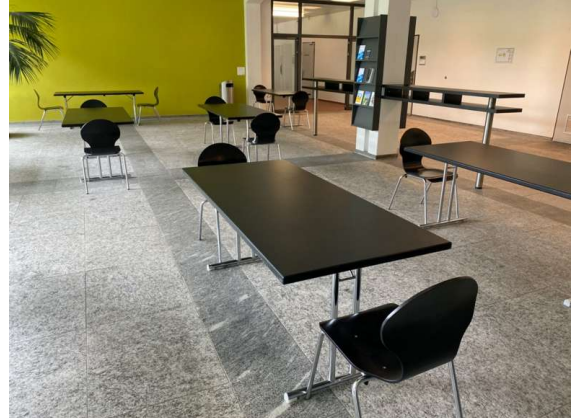
Abbildung 4: KBS Foyer