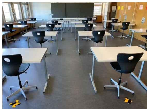
Abbildung 4: GIBS Schulzimmer