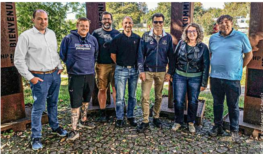
Gruppenbild bei den Feuersäulen vor dem Haupteingang zur Fachschule Froburg.

PS an alle Espresso-Liebhaber: Der Espresso im Restaurant Froburg wurde übrigens besonders gelobt.