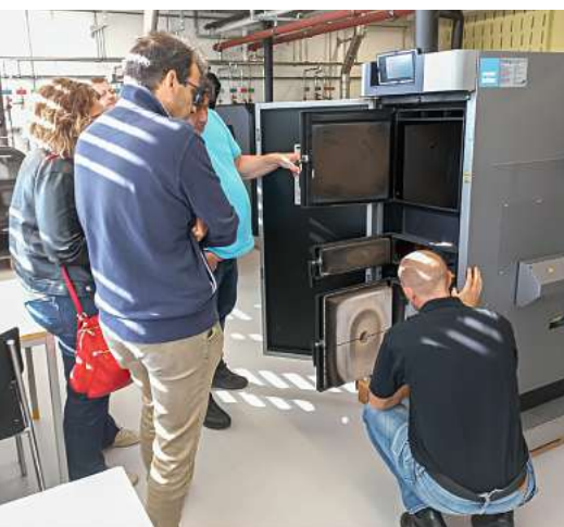
Al Froburg sono disponibili molte più attrezzature per la formazione rispetto al Ticino.

P.S. A tutti gli amanti del caffè espresso: il caffè del ristorante Froburg è stato particolarmente apprezzato.