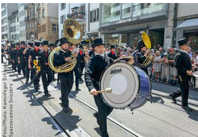
Foto/Photo: Kaminfeger Schweiz, Ramoneur in Suisse, Spazzacamino Svizzero